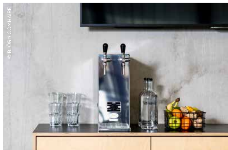
Robinetto maakt watertaps die kraanwater filteren, koelen en eventueel carboniseren.

“Belgen drinken nog altijd meer dan 130 liter flessenwater per persoon per jaar. In Nederland is dat minder dan 25. Als ook wij per persoon 100 liter flessenwater zouden uitsparen, dan hebben we het over 1 miljard liter per jaar.”