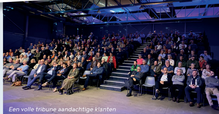
Een volle tribune aandachtige klanten