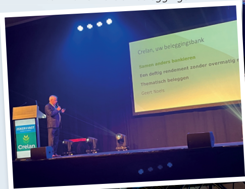
Yvan Morre - Crelan beleggingen