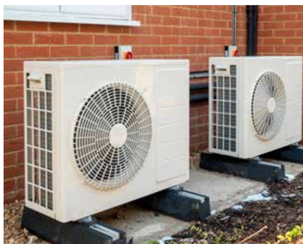
Een warmtepomp haalt warmte uit de omgeving.

Nadelen: Bij koude temperaturen zal de warmtepomp onvoldoende vermogen hebben om een matig geïsoleerde woning aangenaam warm te krijgen. Als de woning niet met een lage temperatuurafgifte werkt, zal de warmtepomp met een lager rendement werken en verbruik je meer elektriciteit. In dat geval neemt de gasketel over, maar dan stijgt ook het gasverbruik én de CO 2 -uitstoot.